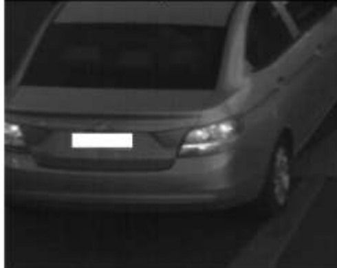
S. FRANCISCO / AV. MATTA (25-10-2017 08:08:52)